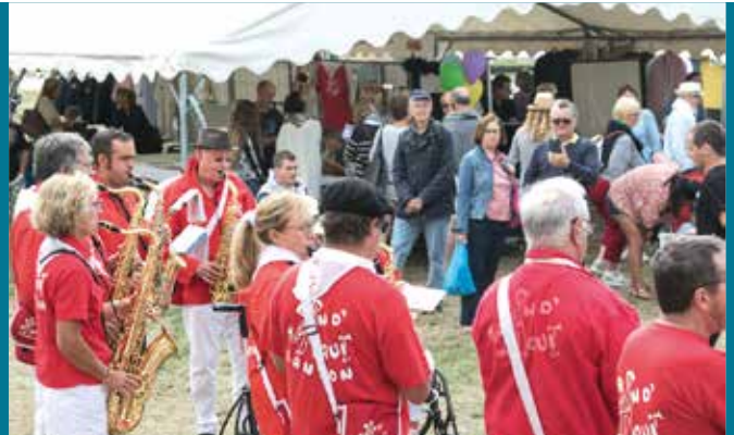
Cette année, le 3 septembre , le plus ancien forum des Associations du Bassin (17ème édition) se conjugait avec une première : l'organisation des Jeux du Cœur de Bassin. Tradition et partage ont fait palpiter cette journée sur l'esplanade de Cassy.