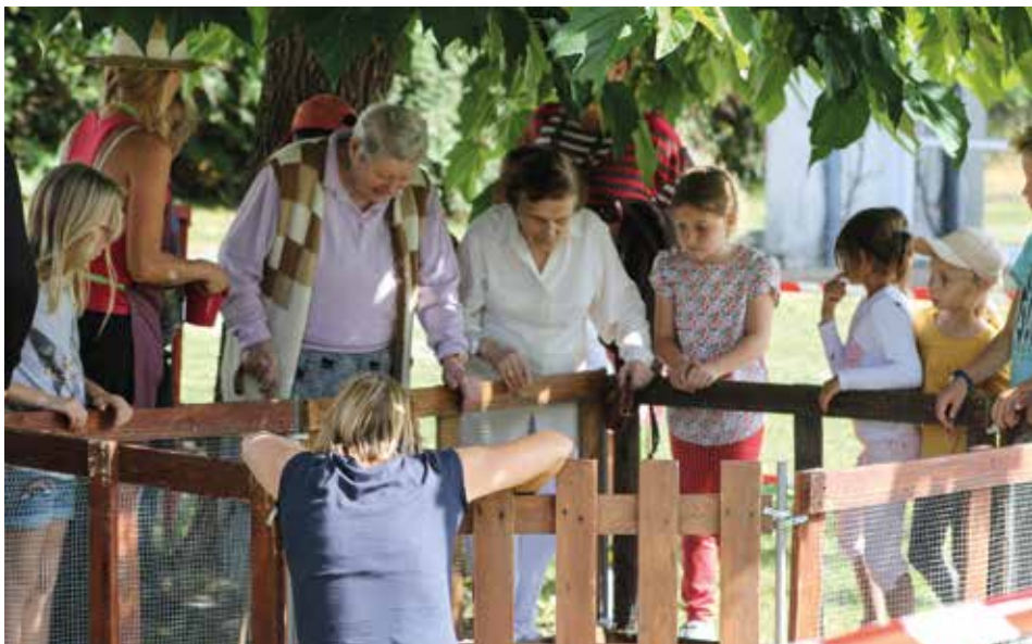
Rencontre intergénérationnelle (sept. 2017).

Appui administratif précieux pour remplir les dossiers de demande d'APA (allocation personnalisée d'autonomie), le CCAS propose aussi un panel de services aux plus de 65 ans : aide à domicile, portage de repas, bois de chauffage ou soutien financier pour bénéficier de la téléalarme. « Le restaurant de la Résidence Autonomie et les animations de l'après-midi sont ouverts chaque jour à tous les séniors de la commune », précise Anne Lorient. « Nous venons