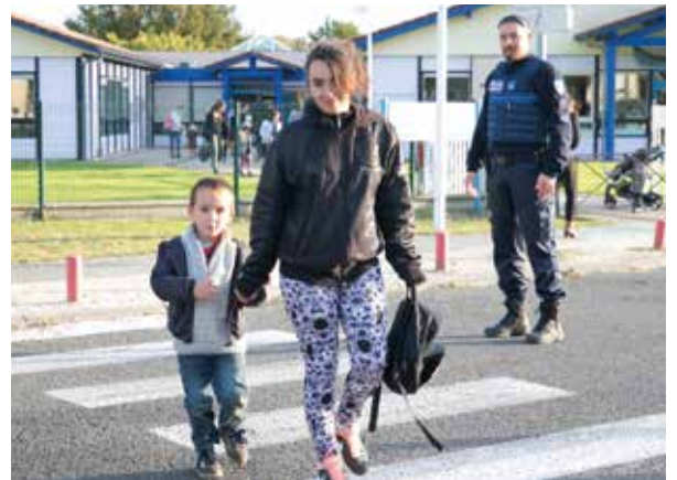
La Police Municipale assure la sécurité à la sortie des écoles tous les matins et soirs.

de prévenir, d'expliquer, de rappeler les règles pour éviter les troubles ou les incidents. » Ainsi, la police municipale est aujourd'hui systématiquement associée aux projets d'aménagement de voirie ou à des réflexions collectives comme celle menée autour du PLU. Un œil précieux sur la sécurité publique, notamment en centre-ville et aux abords des écoles.