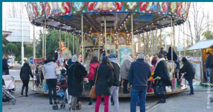
La commune a encore joué les Pères Noël le premier week-end de décembre : marché de Noël, bourse aux jouets, goûter, spectacle, ciné et carrousel gratuit pour tous les enfants. De quoi rêver et se régaler !