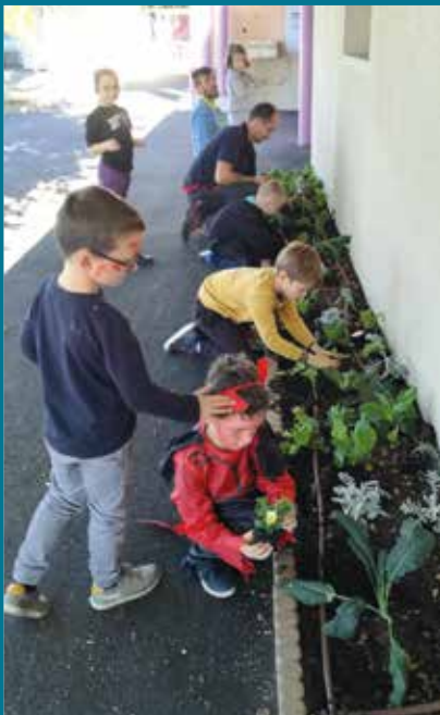
Les enfants de l'Accueil de Loisirs ont mis la main à la terre : ils ont planté 282 petits plants, avec l'aide du service Espaces Verts, pendant les vacances de la Toussaint. Les fleurs s'épanouiront avec eux !