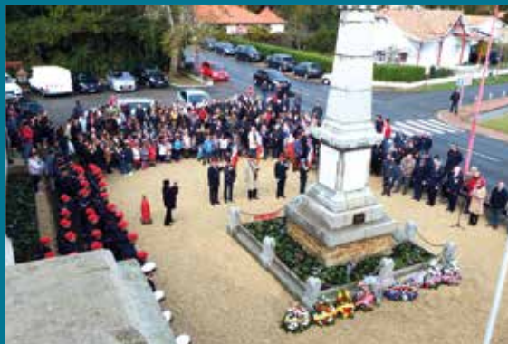
Cérémonie officielle du 11 novembre : anciens combattants, élus, porte-drapeaux, madame le Maire et le Maire du Conseil Municipal des Enfants se sont retrouvés côte à côte pour honorer le devoir de mémoire.