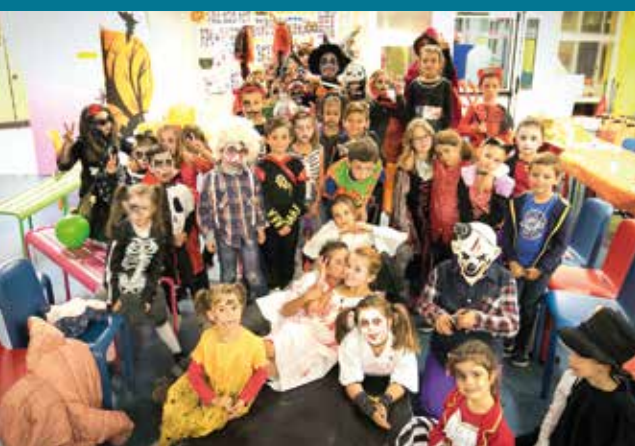
Frissons et défilé de costumes pour Halloween (31 octobre) avec les enfants de l'Accueil de Loisirs !